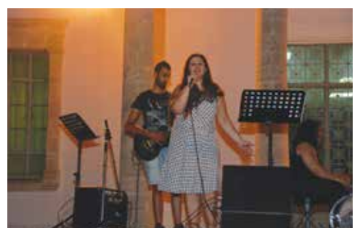
Χοροί και τραγούδια κατά τη διάρκεια του Φεστιβάλ