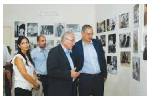
Φωτογραφίες από την τελετή των εγκαινίων του 34ου Φεστιβάλ