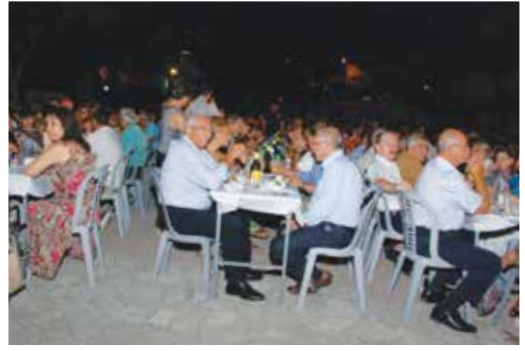
Από τη χοροσπερίδα.