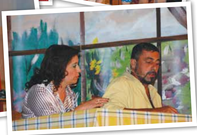
Στιγμιότυπα από τη θεατρική παράσταση «Γελιέται ο Κυπραίος;» της Μαργαρίτας Χαραλάμπους. Το έργο σκηνοθέτησε και ανέβασε η Θεατρική Ομάδα Λευκάρων.