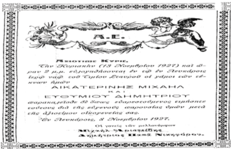
Προσκλητήριο γάμου από το παρελθόν

Και τ' απδονάκι τραγουδεί στην ευωδία του λάδανου τα πάθη της καρδιάς».