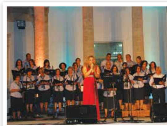
Η χορωδία του Δήμου για τα εικοσάχρονά της τραγούδησε έντεχνα ελληνικά τραγούδια.