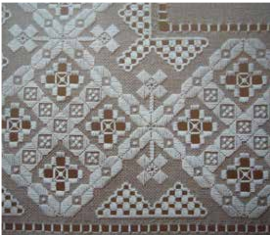
Φωτ. 3 Hardanger

Ομοιότητες υπάρχουν και στην εσωτερική διακόσμηση των κοπτών σχεδίων με δαντέλα, όπως για παράδειγμα το "αραχνωτό" σχέδιο που διακρίνεται και στο λευκαρίτικο και στο "hardanger" της φωτογραφίας 1 και 4 .