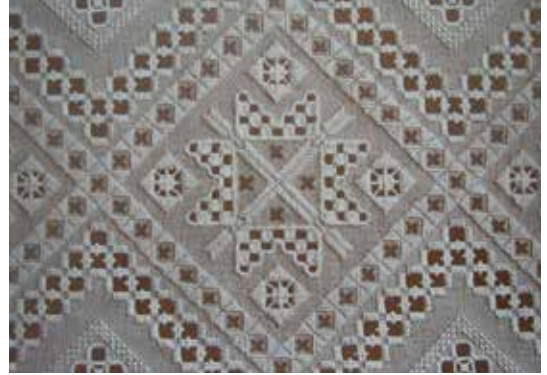
Φωτ. 1 Hardanger

Τα κεντήματα "hardanger" της Νορβηγίας είναι επηρεασμένα από την Ιταλική "redicella", δαντέλα, του 14ου – 16ου αιώνα, όπως και τα λευκαρίτικα. Παρόλο που προσομοιάζουν και έχουν κοινά στοιχεία με τα λευκαρίτικα, έχουν διαφορές ως προς τη δομή των σχεδίων και την τεχνική της κατασκευής τους.