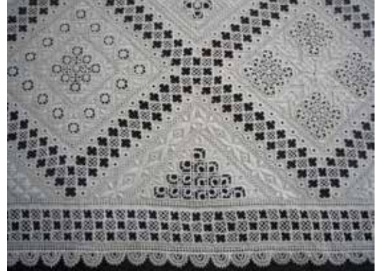
Φωτ 4 Λευκαρίτικο

Ένας άλλος λόγος που καθιστά το λευκαρίτικο τόσο ξεχωριστό και ιδιαίτερο είδος κεντήματος, είναι η δομή, τα ιδιαίτερα χαρακτηριστικά, η αρμονία και η ποικιλία που παρουσιάζει στα σχέδιά του. Στο αυθεντικό λευκαρίτικο κέντημα το κοπτό σχέδιο ακολουθείται και εναλλάσσεται με το "γεμωτό", δηλαδή ανεβατό σχέδιο, πράγμα που δεν συμβαίνει στα "hardanger".